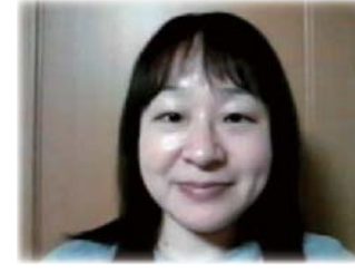
山形県 K. Sさん

昨日ホテルでリザルトを私の首にかけて下さってから何分も立たないうちに背中がそっくり返るくらい姿勢が良くなり、また両足の裏が大地にしっかり着き体の中心がまっすぐになったと感じました。長時間お話している間一度も足を組むこともなく座っていられたことは毎日の生活の中では考えられないことでした。私は永年パソコンに向かい長時間同じ姿勢で仕事をしているため、体が左に傾き、左肩が下がり、左足が短く、噛み合わせも悪く、握力もなく、数え上げればきりがありません。その後ホテルを出て歩き始めると左の骨盤近くに痛みがあり何か反応が現れていると感じていました。帰宅後食事中気がつけば噛み合わせが良くなっており・又、普段から握力が弱くおはしで食物を口に運ぶことの苦手な私にとって不思議な位スムーズに口に運べていたのです。又いつまでも正座が出来ている自分にも驚きました。朝目が覚めたとき、左右の足の親指がしっかりくっつき両足もまっすぐ直立不動で寝ていたさまに気づきました。きっと、聖中心がまっすぐになり不具合のところ改善されたと思われまます。最後に大切なものを貸して下さり有難う御座いました。感謝！